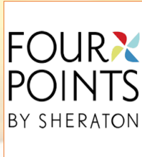
Four Points By Sheraton