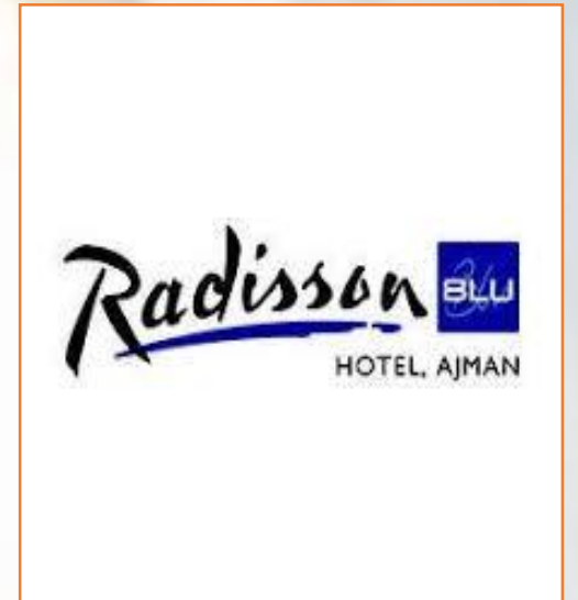
Radisson Hotel, Ajman