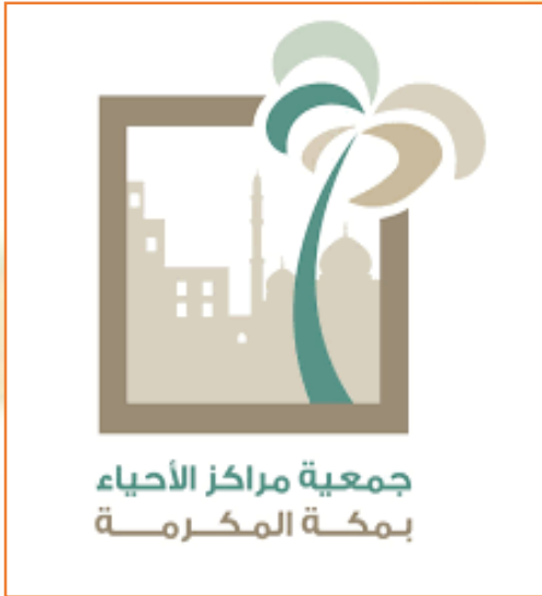
Makkah Community Centers