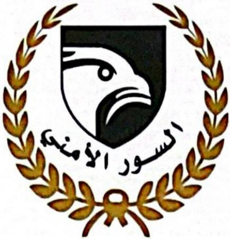
Al Sur AlAmni