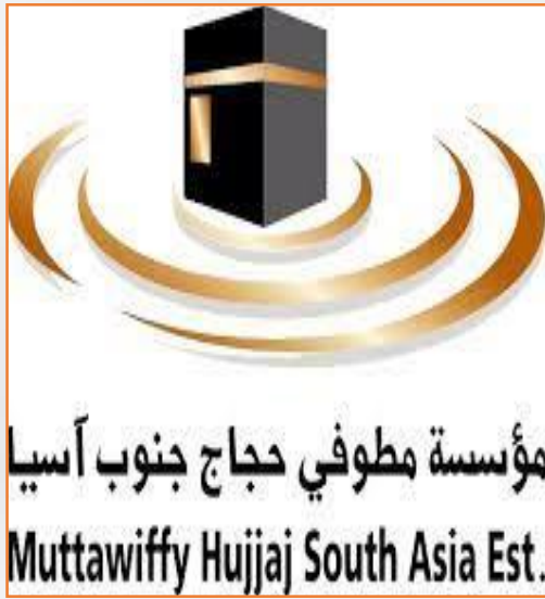
Muttawiffy hujjaj South Asia Establishment