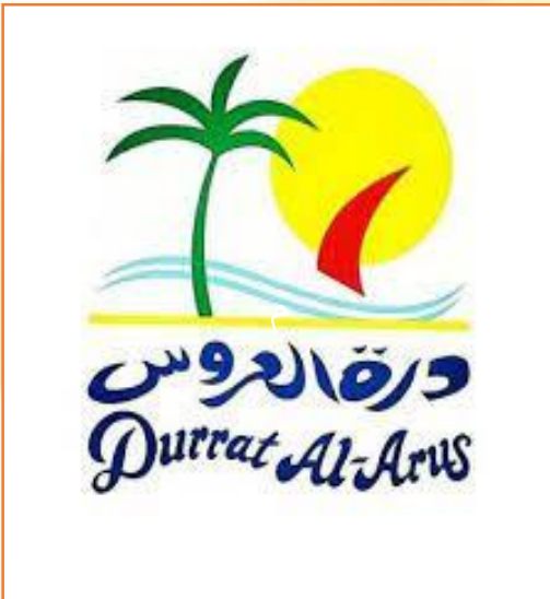
Durrat Al Arous